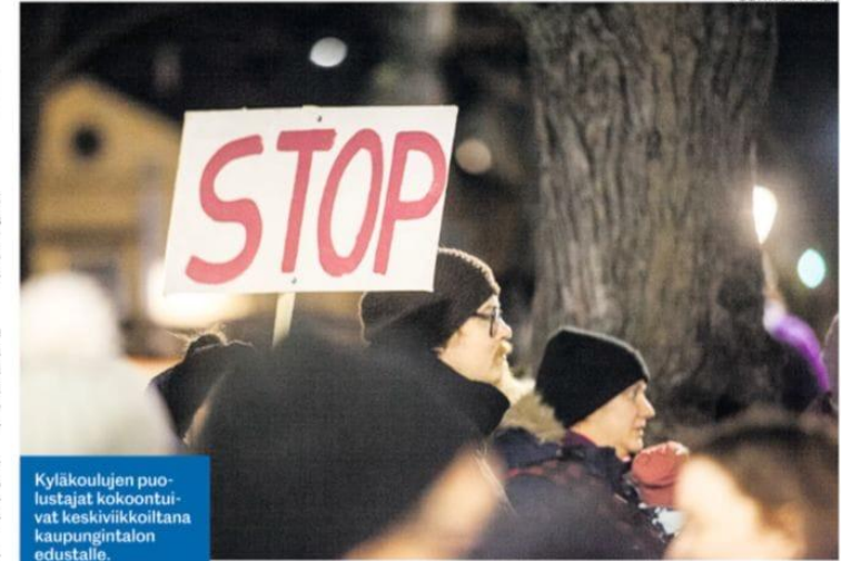
Kyläkoulujen puolestajajat kokoontuivat keskiviikkoiltana kaupungintalon edustalle.

Kokonniemestä puuttuu asiantuntemus: Porvoon kaupunginhallitus hyväksyi maanantaina Kokonniemen liikuntakeskuksen hankekehityssopimuksen ja -suunnitelman (UM 13.11). – Se raaka kivireen vetäminen pitäisi pian aloittaa, jotta päästään joskus maaliin, toriparlamentin grynderijäsen huomautti. Miljoonien euron kysymys kuuluu nyt, millainen porukka hankkeen toteutukseen saadaan valjastettua. Hankesuunnitelmassa korostetaan Kokonniemen Liikuntakeskus Oy:n mahdollisuutta rekrytoida ammattitaitoinen henkilöstö. – Yhtiön merkittävin hyöty kaupungille on sellaisen liikuntarakenntamisen asiantuntemuksen hankkiminen, jota kaupungilla ei itsellä ole, suunnitelmassa todetaan. – Huojentavaa, että Porvoon viimein tunnustaa tosiasiat, varavaltuutettu kiitteli. Usko Lamoriin hiipuu: Porvoon ainoan pörssinoteeratun yhtiön Lamor Corporationin osakkeesta sai kaksi vuotta sitten maksaa 4,75