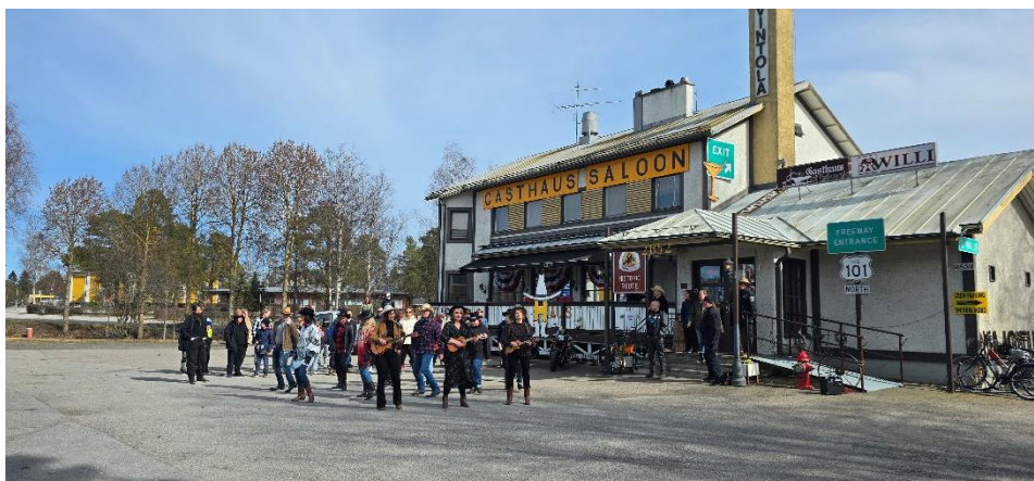
Katalat-bändin musiikkivideon kuvaukset Himangalla.

Toimintavuonna järjestön toiminnanjohtaja kiersi 16 maakunnallisen kyläyhdistyksen alu- eella tutustuen paitsi maakunnallisen kyläyhdistyksen myös Leader-ryhmien toimintaan.