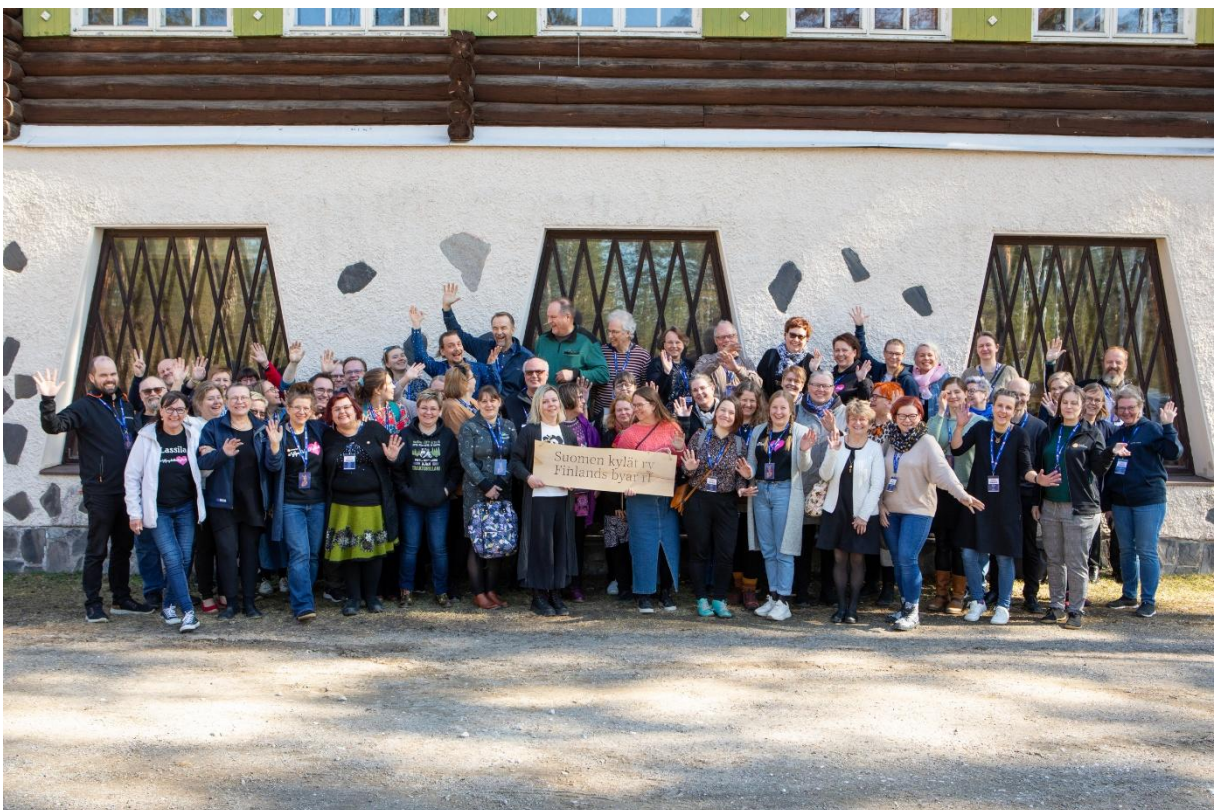
Kevään kyläpäivät Pieksämäellä

Suomen Kylät ry:n jäsenjärjestöjen lukumäärä vuonna 2025 oli 122. Näistä 15 on maakunnallisia kyläyhdistyksiä ja 53 Leader-ryhmiä. Aktion Österbotten rf, Elävä-Kainuu Leader ry, Kehittämisyhdistys SILMU ry ja Päijänne Leader ry edustavat sekä seudullista Leader-toimintaa että maakunnallista kylätoimintaa, joten maakuntatason kylätoimijatahoja on yhteensä 19. Valtakunnallisia jäsenjärjestöjä oli 14 sekä kylä- ja kaupunginosayhdistyksiä sekä muita vastaavia paikallisia järjestöjä oli 27. Maakuntaliittoja ja muita maakunnallisia järjestöjä oli jäsenenä 13.