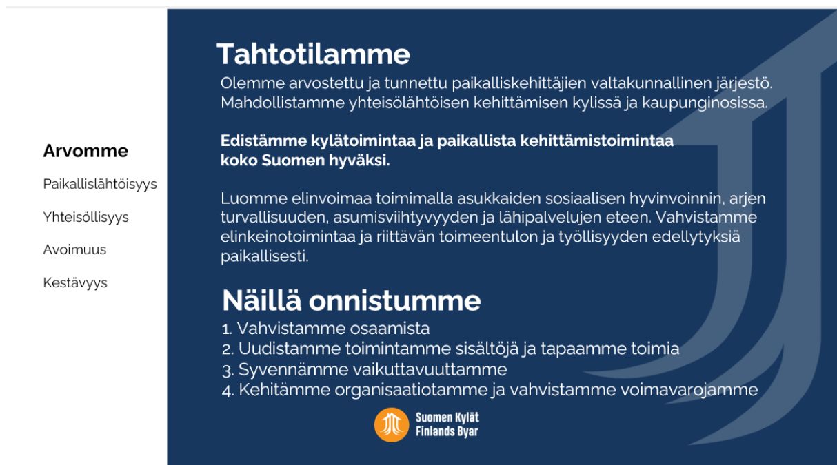
Strategia kuva 1.

Toimintavuoden aikana toteutettiin vuoden 2024 aikana järjestössä laadittua strategiaa. Kevään 2025 aikana laadittiin strategian toimintaohjelma, joka ohjasi toimintavuotta ja tulevien vuosien toiminnansuunnittelua.